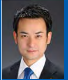
井川 直樹 君 公益社団法人 日本青年会議所 第61代会頭