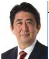
安倍 晋三 氏 元内閣総理大臣